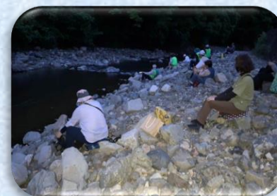
10月水無瀬の滝 周辺歴史探訪