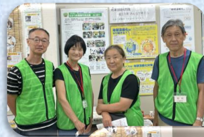
9月NPO協働 フェスタ （総合C）