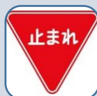
この標識は自転車も 守らないといけない