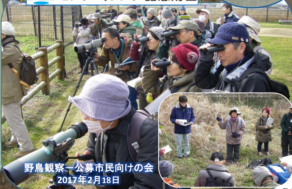
野鳥観察一公募市民向けの会 2017年2月18日