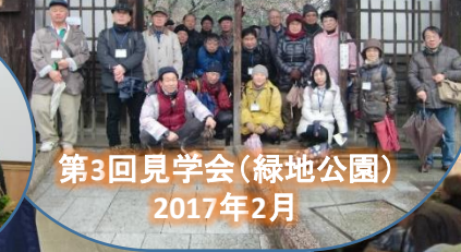
第3回見学会(緑地公園) 2017年2月