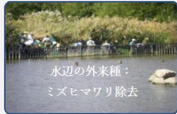
水辺の外來種： ミズヒマワリ除去