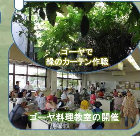
ゴーヤで 緑のカーテン作戦