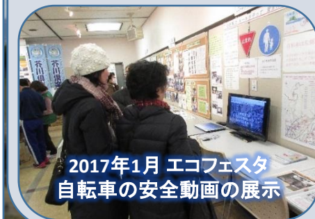
2017年1月 エコフェスタ 自転車の安全動画の展示