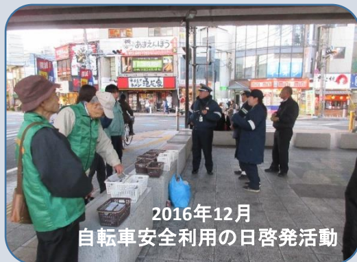
2016年12月 自転車安全利用の日啓発活動