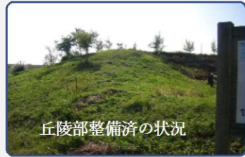
丘陵部整備済の状況