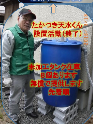
たかつき天水くん 設置活動(終了)