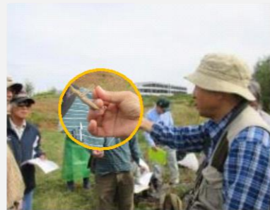
昆虫の観察会 - ショリョウバ