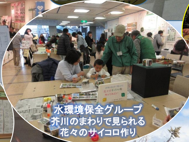
水環境保全グループ 芥川のまわりで見られる 花々のサイコロ作り