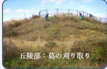
丘陵部：葛の刈り取り