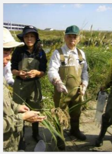
ススキ・オギの区別は