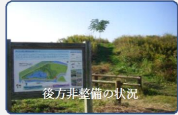
後方非整備の状況