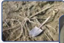
葛根 1.5Kg から