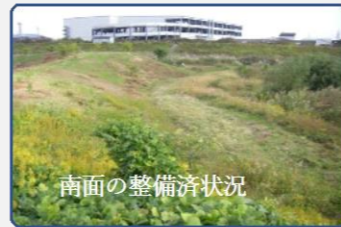
南面の整備済状況