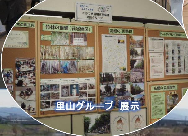
里山グループ 展示