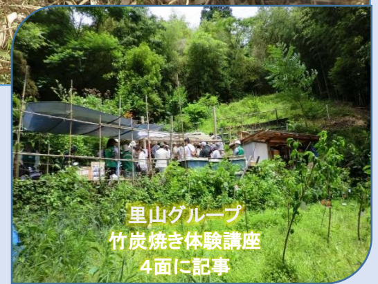
里山グループ 竹炭焼き体験講座 4面に記事