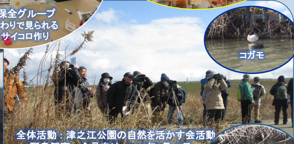
全体活動：津之江公園の自然を活かす会活動 野鳥観察一会員向け 2017年2月10日