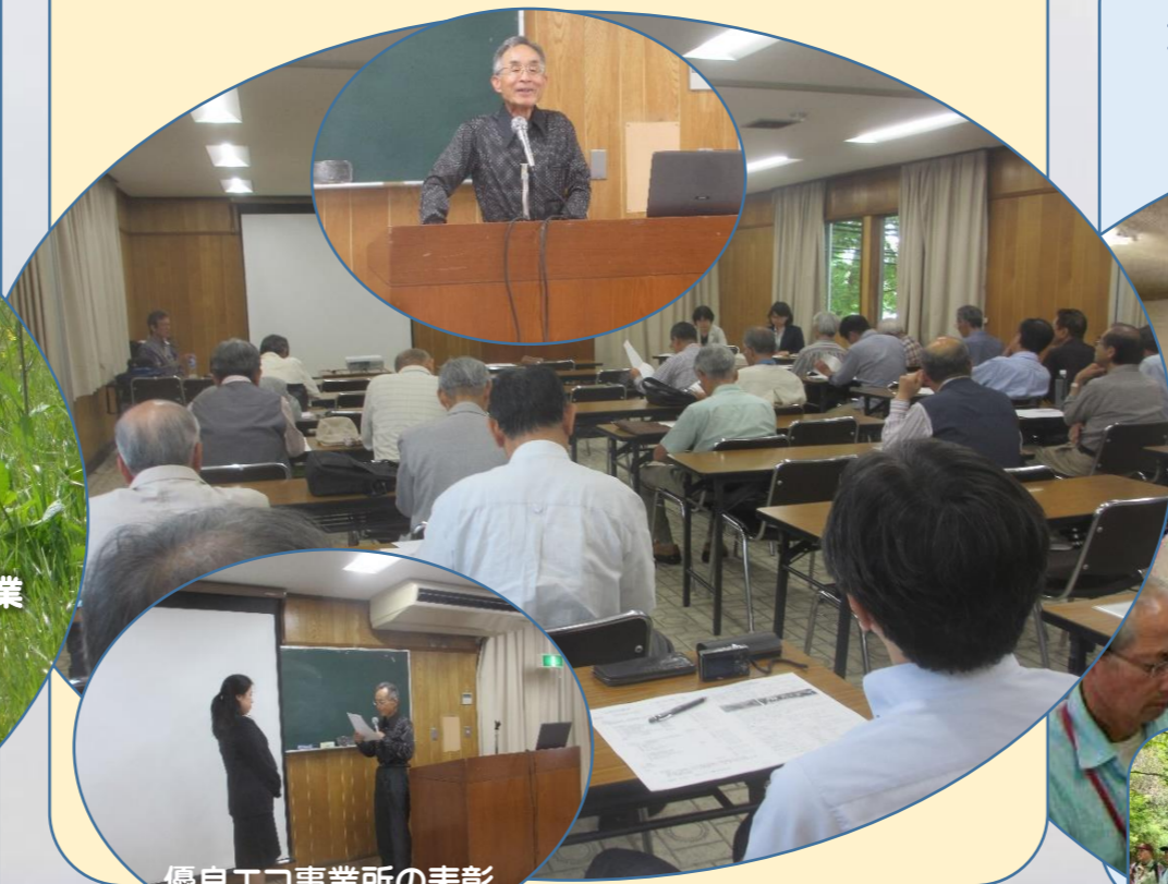
優良エコ事業所の表彰