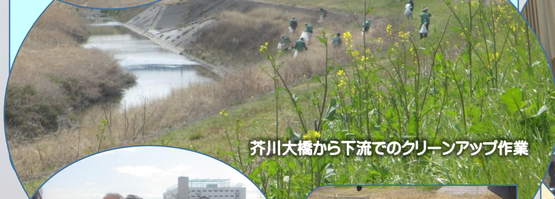
芥川大橋から下流でのクリーンアップ作業