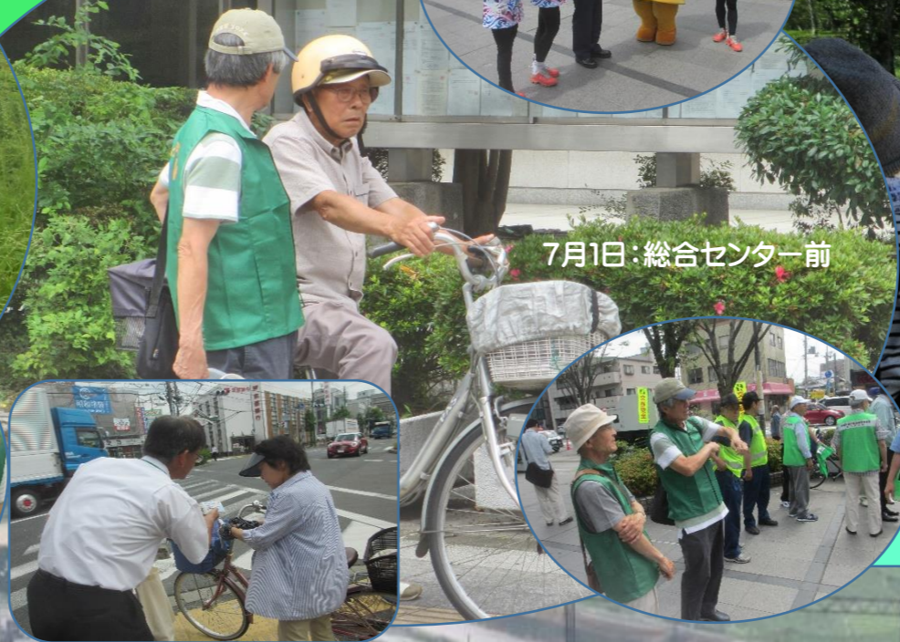
7月1日:総合センター前