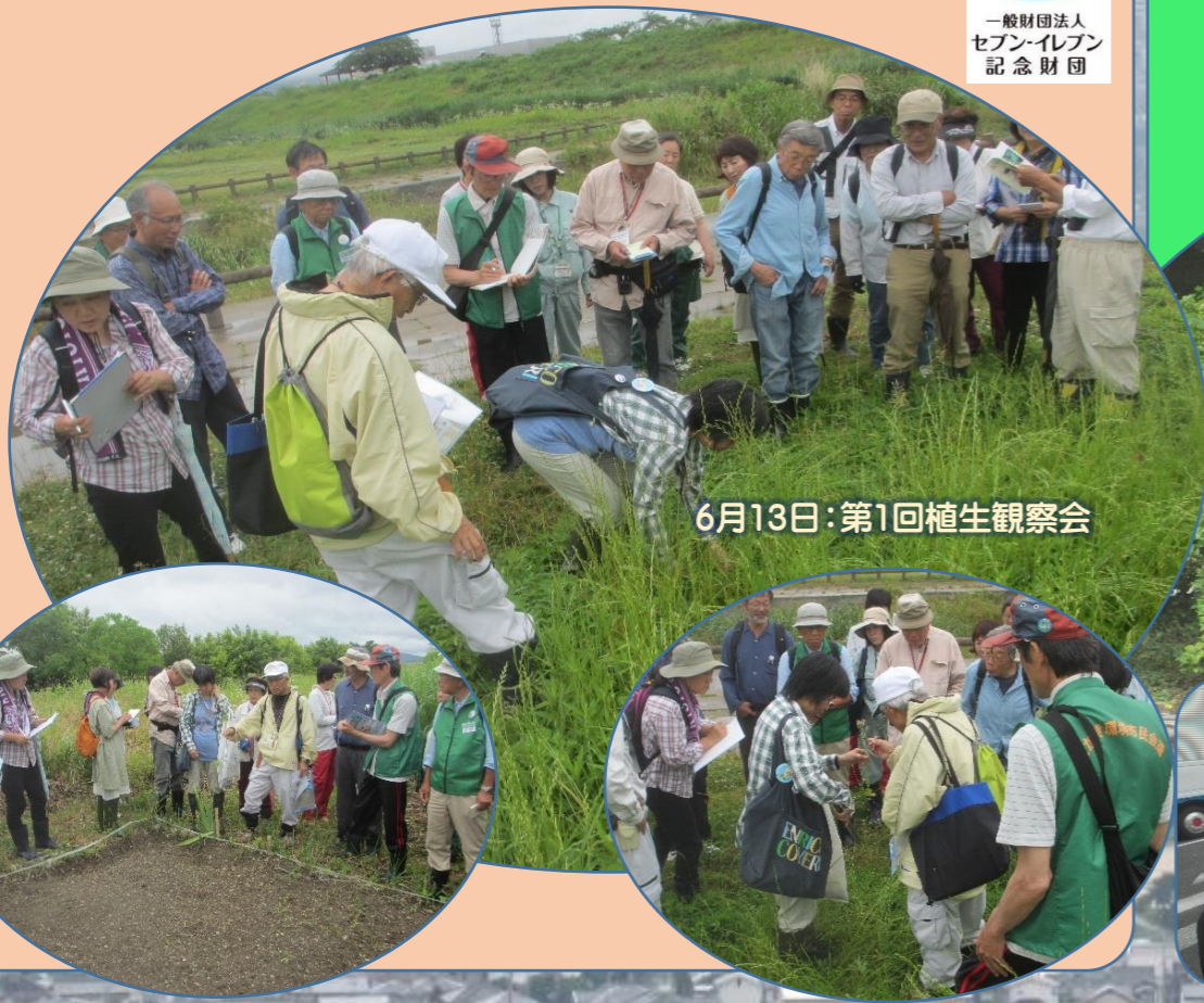
6月13日:第1回植生観察会