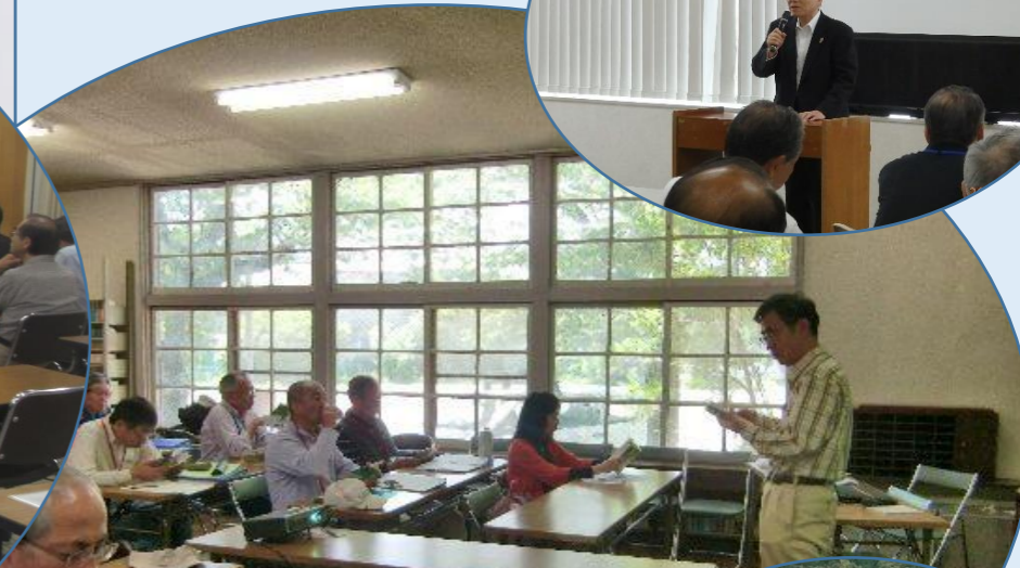
6月2日:原公民館での講座