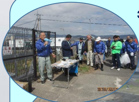
3月23日:淀川・芥川クリーンアップ大作戦に参加